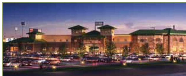
StarTex体育场，糖城双向飞碟运动员的未来之家

我们正在为再创造和娱乐提供更多的选择。这些工程包括混合用途项目，丰富的社区活动，和将于2012年开放，耗资三千万美元的StarTex体育场，一个独立的大西洋联盟棒球馆和多用途会场。