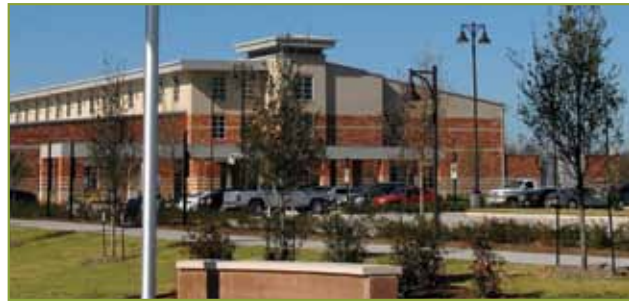
休斯顿社区学院 — 密索里城

我们的小学和中学持续处于顶级水平。而我们的高等教育机构 - 地处新科兰奇和糖城的休斯顿大学校区，地处糖城的沃顿郡专科学校(WCJC)，地处斯塔福德和密索里城的休斯顿社区学院，地处里奇满的德州技术学院与沃顿郡专科学校伙伴关系等等，让学生们在教育上花的钱能有最高的价值。